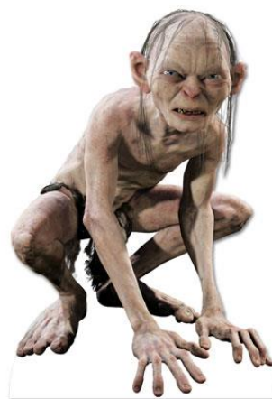
Figures 1 i 2: Comparació entre l'aparença física d'un nibelung i de Gollum