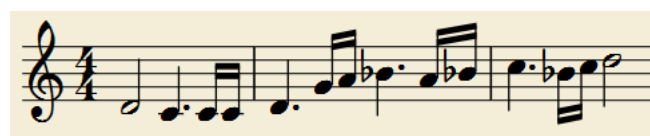
Figura 6: Tema de l'heroisme al Senyor dels Anells