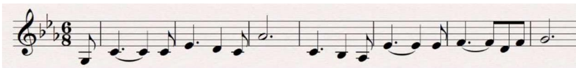
Figura 5: Tema de l'heroisme a Wagner

En la tercera òpera, Siegfried, el fill de Sigmund i Siglinda i el qual dona el nom a l'obra, emprèn un viatge amb l'objectiu de recuperar l'anell. Per tant, podem comparar l'empresa de Frodo, qui ha de dur l'anell a Mordor per tal de destruir-lo, amb la de Siegfried, qui ha de trobar-lo. Ambdós són herois que han hagut de sacrificar la seva vida per tal d'acabar amb el maliciós poder de l'anell. El leitmotiv de Siegfried com a heroi és semblant al motiv de la Comunitat de l'Anell, que emmarca l'aventura cap a les perilloses i obscures terres de Mordor: