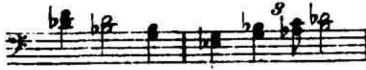
Figura 3: Tema de l'anell a Wagner

En el cas de Wagner trobem dos leitmotivs crucials en aquest inici: el del poder de l'anell i el de la renúncia d'Alberich a l'amor. En el cas de l'anell, aquest també té un motiv en la pel·lícula de Peter Jackson, i de fet les músiques són força semblants, tal i com es pot constatar en les Figures 3 i 4: