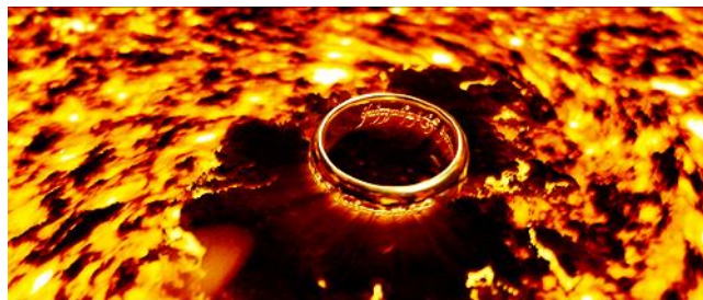
Figura 7: Destrucció de l'anell en la pel·lícula del Retorn del Rei , envoltat de lava

Finalment, en el Capvespre dels Déus té lloc l'acabament de la trama: Siegfried és assassinat i Brunhilda, la seva amant, acaba la feina que ell havia començat i destrueix l'anell enmig del foc. En el cas del Senyor dels Anells, podem trobar un cert paral·lelisme entre Brunhilda i Sam. Tot i que en un cas es tracta d'una relació amorosa i en l'altra d'amistat, Brunhilda, igual que Sam, sempre ajuda el seu company a superar les dificultats i el salva de diversos perills. I en canvi, tot el protagonisme i reconeixement el rep l'altre personatge. Per exemple, en el Senyor dels Anells, Sam salva Frodo de l'aranya a Minas Morgul. A més, quan per fi arriben al Mont del Destí, Frodo no és capaç de resistir la temptació de l'anell i sucumbeix al seu poder. És Sam qui procura que l'anell s'acabi de destruir, de la mateixa manera que ho fa Brunhilda. En els dos casos observem una relació de lleialtat i fidelitat. També és rellevant la presència del foc: en Wagner l'anell s'acaba destruint a causa del foc que s'origina i en les pel·lícules l'anell es llença a la lava del Mont del Destí.